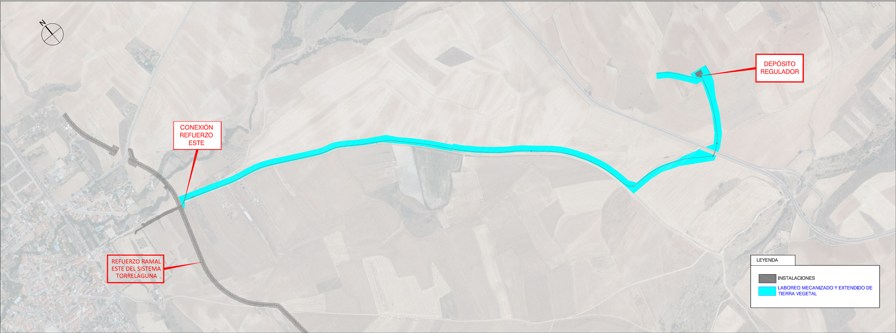
PLANTA ESCALA 1/10.000